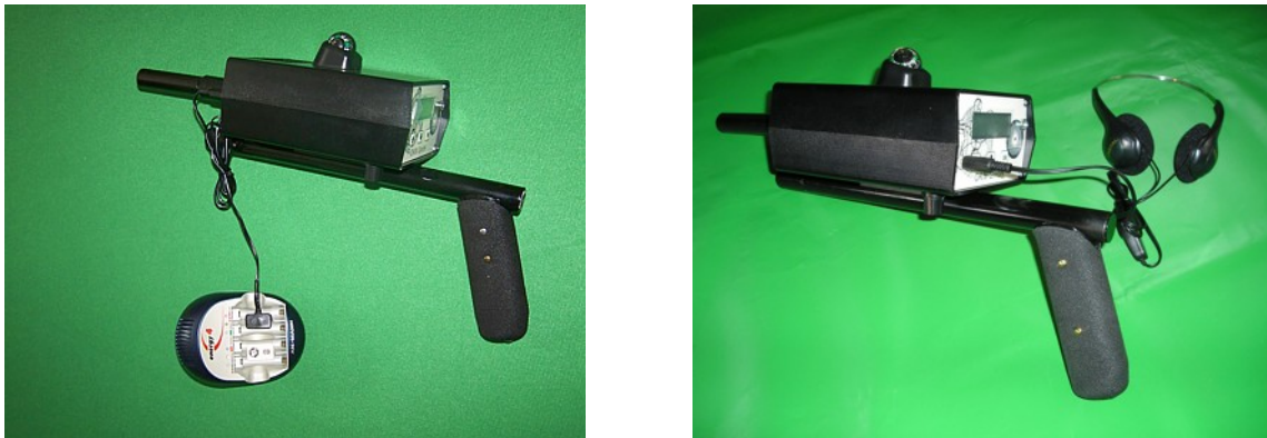
Figure 5.2: Connexion du chargeur et des écouteurs

La figure 5.1 montre comment on doit connecter la sonde à l'appareil. Connectez la sonde sans puissance!