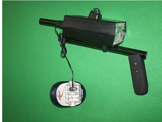
Figure 8.2: Branchement du chargeur

Pour charger le Bionic alpha il faut brancher le chargeur délivré avec son câble à la connection correspondante de l'appareil comme représenté dans la figure 8.2.