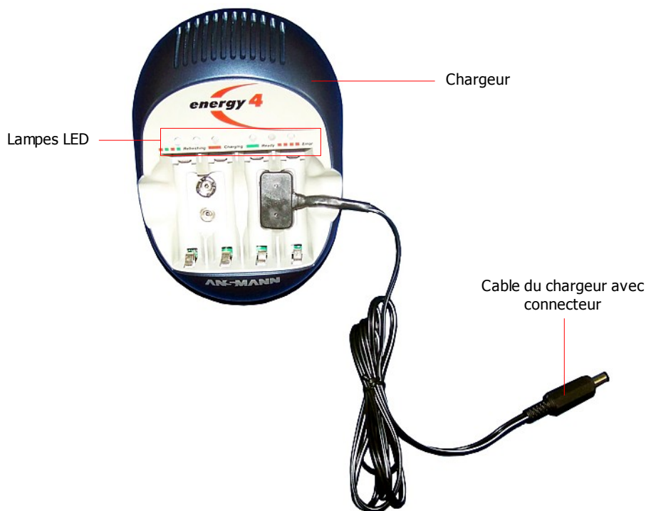
Figure 8.1: Le chargeur et ses éléments

Le chargeur automatique de la figure 8.2 possède une fonction pour rafraîchir, qui donne une plus grande durée de vie pour les batteries internes.