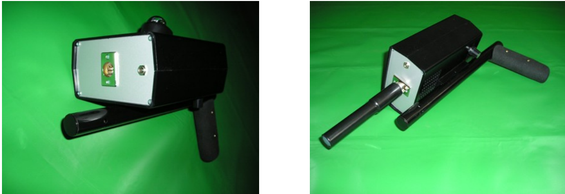
Figure 5.1: Assemblage et connexion des sondes

Dans ce section on vous montre comment assembler l'appareil et comment le préparer pour les mesures.